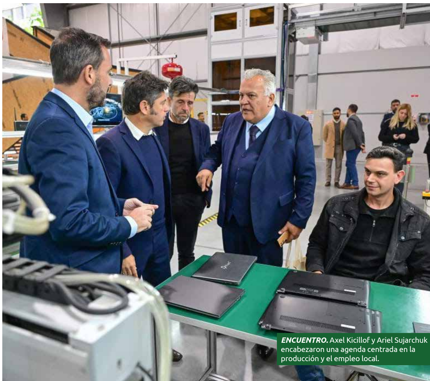
ENCUENTRO. Axel Kicillof y Ariel Sujarchuk encabezaron una agenda centrada en la producción y el empleo local.

El punto más destacado de la jornada fue la visita a Pixart Argentina, empresa radicada en Loma Verde dedicada al desarrollo de hardware y software que