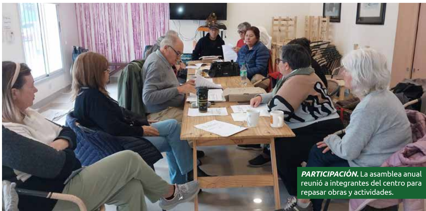
PARTICIPACIÓN. La asamblea anual reunió a integrantes del centro para repasar obras y actividades.

Desde la entidad también valoraron el acompañamiento de la Cooperativa Eléctrica Escobar Norte, que mantiene vigente el comodato del espacio