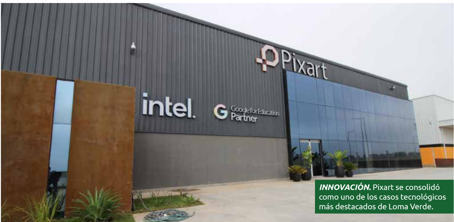
INNOVACIÓN. Pixart se consolidó como uno de los casos tecnológicos más destacados de Loma Verde.