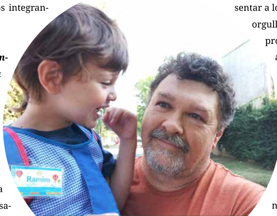
REFUGIO. Urrels define a Loma Verde como un lugar de pertenencia para su familia.

Hay muchas cosas, pero sigo monotemático, creo