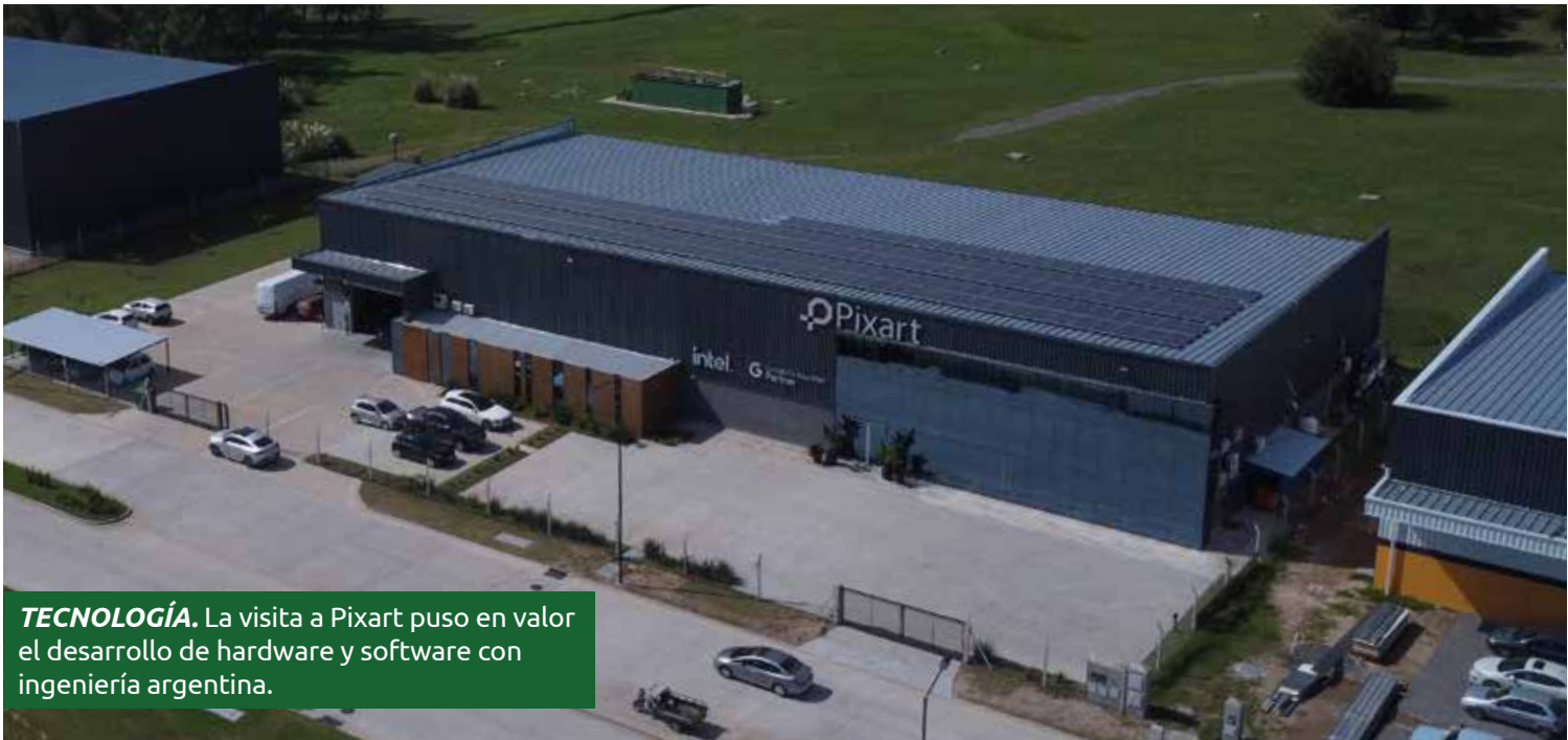
TECNOLOGÍA. La visita a Pixart puso en valor el desarrollo de hardware y software con ingeniería argentina.

logró posicionarse como socia estratégica de Qualcomm en Latinoamérica. La firma emplea procesos de nanotecnología y robótica de precisión para producir computadoras de alta gama con ingeniería 100% local, convirtiéndose en un caso emblemático de innovación tecnológica con base nacional.