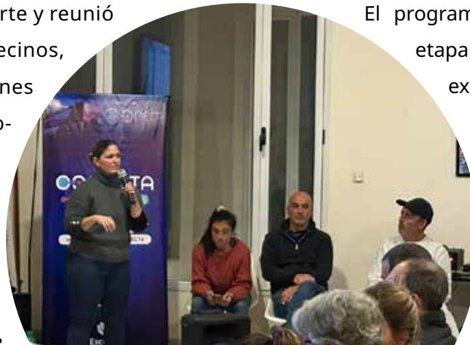
ENCUENTRO. Vecinos e instituciones participaron del taller del Presupuesto Participativo realizado en la cooperativa.

los talleres. Para ello deben ingresar a www.escobar360.gob.ar y completar el formulario en la solapa “Presupuesto Participativo 2026”. Las consultas pueden realizarse por WhatsApp al 11 2169 4283 o por correo a consultas@escobar360.gob.ar . Más adelante la votación se realizará de manera digital a través de la plataforma y la app Escobar 360. En octubre se llevará a cabo un evento central para premiar los proyectos elegidos y celebrar los 10 años del programa.