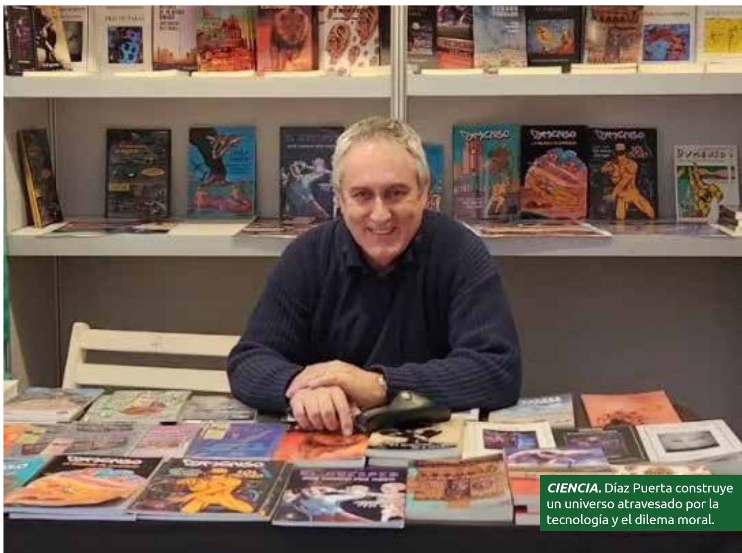
CIENCIA. Díaz Puerta construye un universo atravesado por la tecnología y el dilema moral.

Sin permiso ni compasión, y en contra de su voluntad, deciden trasladar su mente a un recipiente conectado a un robot humanoide. El objetivo: controlar al autómatas usando solo sus pensamientos, creando un híbrido que desafíe la comprensión del libre albedrío.