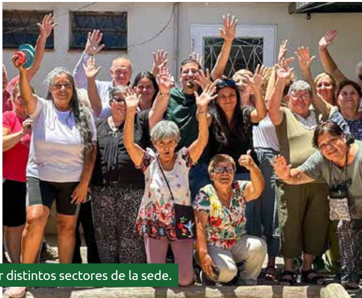
MEJORAS. Nuevos aportes permitieron ampliar y acondicionar distintos sectores de la sede.

donde funciona la institución y además brinda sin costo los servicios de electricidad e internet, una colaboración considerada fundamental para el sostenimiento de las actividades diarias.