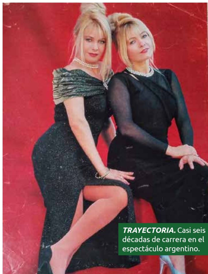
TRAYECTORIA. Casi seis décadas de carrera en el espectáculo argentino.