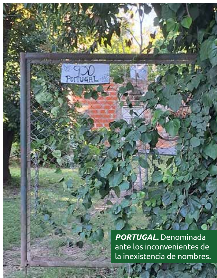
PORTUGAL. Denominada ante los inconvenientes de la inexistencia de nombres.

Con estas siete ordenanzas, Loma Verde Oeste da un paso fundamental hacia el ordenamiento urbano, facilitando la vida cotidiana de sus habitantes y mejorando los servicios que dependen de una correcta identificación de las calles. ©