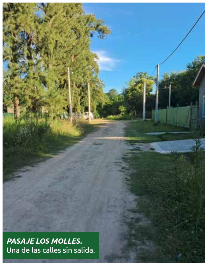
PASAJE LOS MOLLES. Una de las calles sin salida.