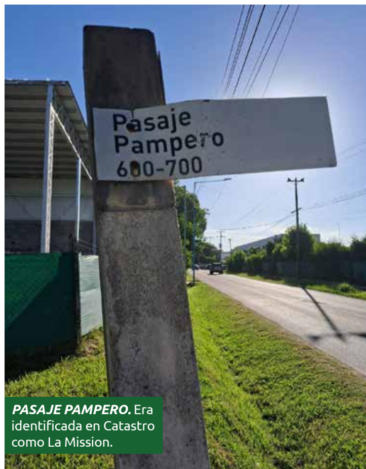
PASAJE PAMPERO. Era identificada en Catastro como La Mission.