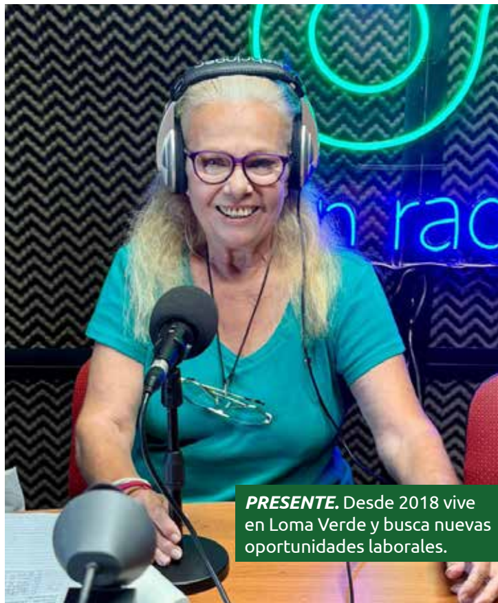
PRESENTE. Desde 2018 vive en Loma Verde y busca nuevas oportunidades laborales.