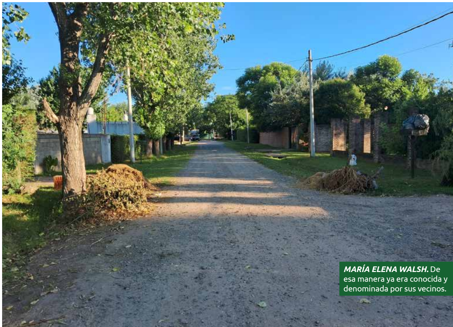
MARÍA ELENA WALSH. De esa manera ya era conocida y denominada por sus vecinos.