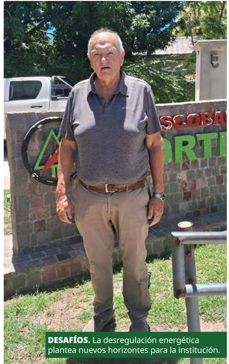
DESAFÍOS. La desregulación energética plantea nuevos horizontes para la institución.

Complicado, pero creemos que es beneficioso para ambos lados. Para la industria que va a poder comprar al generador y para nosotros mismos que también vamos a poder comprar ahora al generador, y no al distribuidor como es ahora Edenor. La coo-