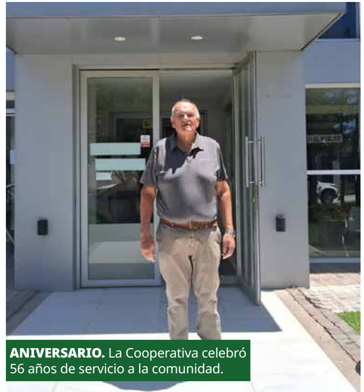
ANIVERSARIO. La Cooperativa celebró 56 años de servicio a la comunidad.