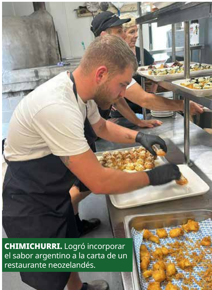
CHIMICHURRI. Logró incorporar el sabor argentino a la carta de un restaurante neozelandés.