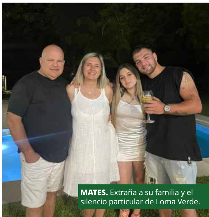
MATES. Extraña a su familia y el silencio particular de Loma Verde.

sponsor a través de mi jefe, conocí a una familia mendocina que me ayudó a extender mi permiso de turista por medio año más. Al poco tiempo, entré a una pizzería y luego me contrataron en Hook. Nueva Zelanda usa el sponsoreo, como modo de contratación laboral en áreas donde no hay mano de obra local para desempeñar ciertas tareas que están en la lista de las profesiones más buscadas. El empleador respalda con una visa de trabajo y como contrapartida, el empleado sólo debe trabajar para él.