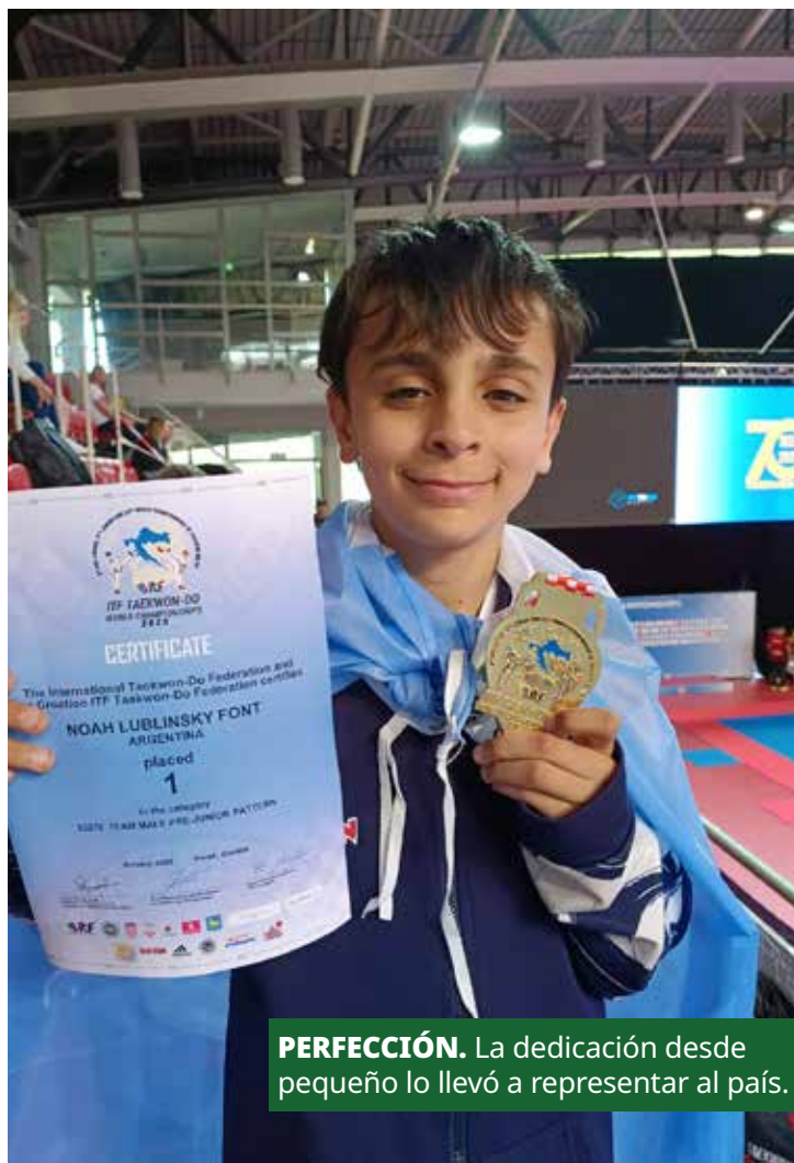
PERFECCIÓN. La dedicación desde pequeño lo llevó a representar al país.

puños para adelante. Otras personas también elogiaron mi combate y entonces saqué de la cabeza que había perdido y me empecé a decir: yo puedo.