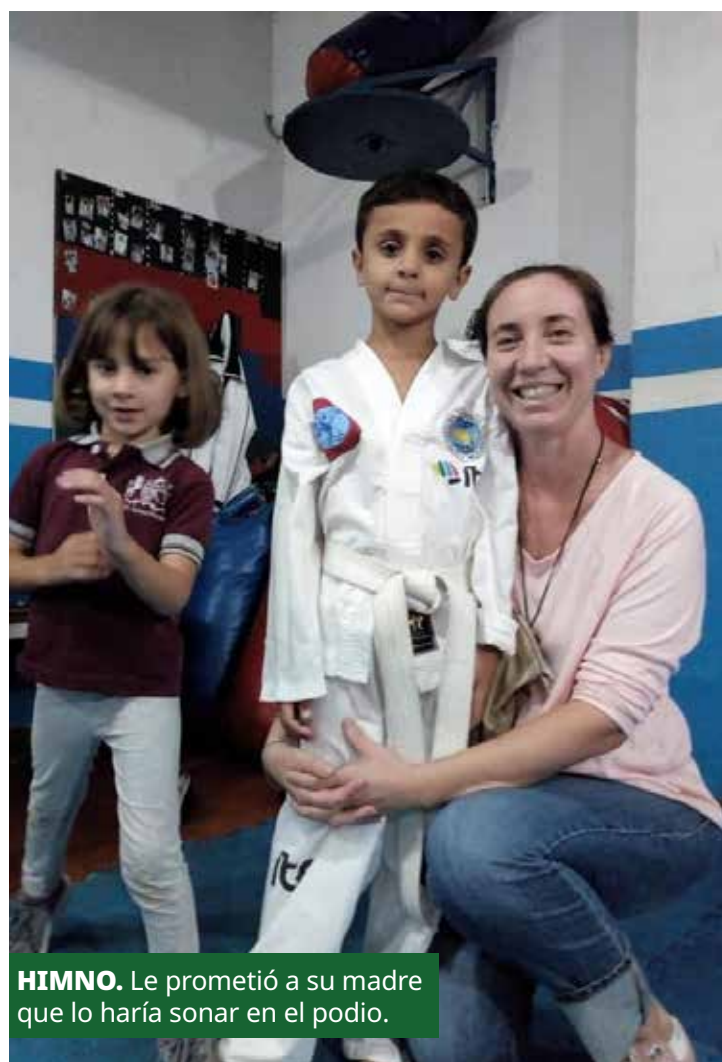
HIMNO. Le prometió a su madre que lo haría sonar en el podio.

Cuando el juez puso la mano para nuestro lado no podíamos festejar, teníamos que saludar y después nos abrazamos y lloramos. Fue una sensación muy linda. Los mundiales organizados por la ITF son cada dos