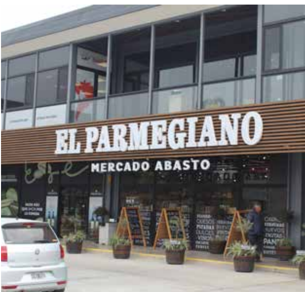
TERREMOTO ECONÓMICO. Loma Verde sacude el mercado con nuevos centros comerciales.