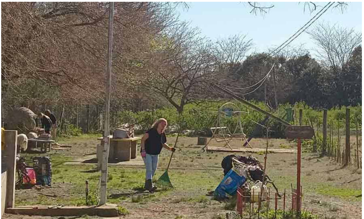
EQUIPO. Tendiendo Puentes busca fomentar el compromiso ciudadano.