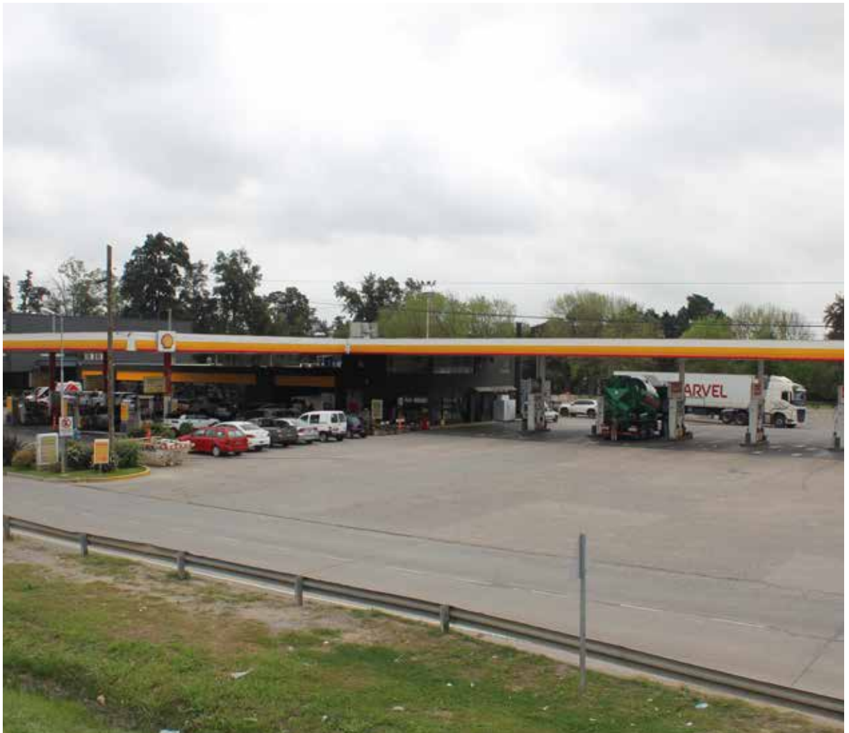
EL CENCERRO. Una historia familiar de éxito.