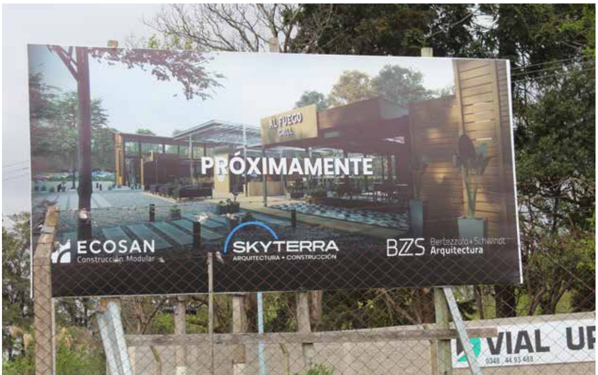
ECOLÓGICO. El nuevo centro comercial utiliza contenedores en desuso.