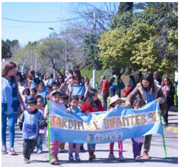
DESFILE. Instituciones y entidades de bien público dieron el presente por la mañana.