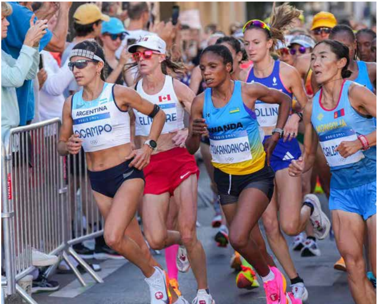
META. Competir en los Juegos Olímpicos de París, un sueño cumplido.

La neerlandesa Siffan Hassan se coronó campeona olímpica con un tiempo de 2:22:55, seguida de cerca por la etíope Tigst Assefa (2:22:58) y la keniana Hellen Obiri (2:23:10), en una final que mantuvo al público al borde de sus asientos hasta el último segundo.