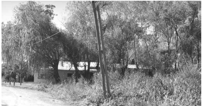
BOOTE Y CONGREVE. En el terreno cedido por la capilla se hará una cancha de fútbol.

Además de entretener a los chicos con el deporte, la idea también incluye la puesta en marcha de talleres que tengan salida laboral. “Eso lo vamos a ir programando con el tiempo, tenemos chicas que son artesanas y están dispuestas a colaborar. Para eso también ofreció un lugar cerra-