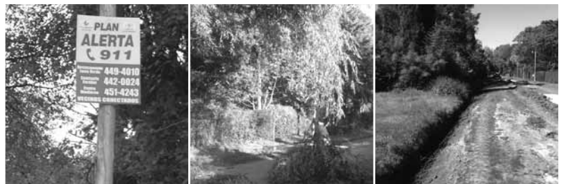
INICIATIVAS. Carteles de seguridad, poda y zanjeos en la calle Málaga.

porque era muy costoso”, señala. En cambio, pusieron los carteles del Plan Alerta con los números del Destacamento, la comisaría de Escobar y el Centro de Monitoreo.