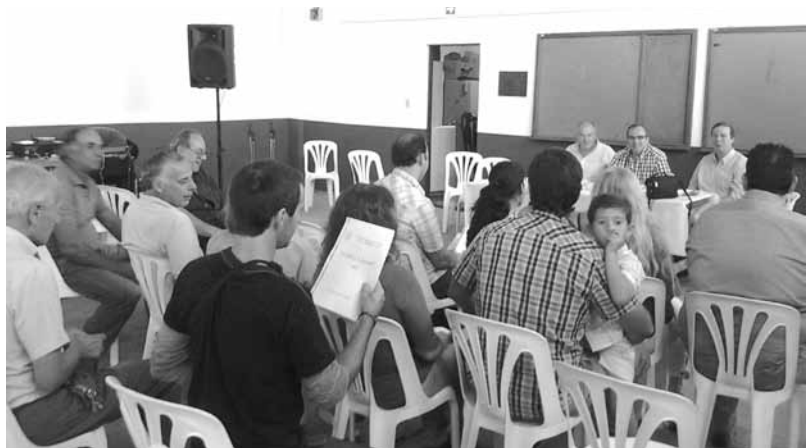
ASAMBLEA. La asistencia de socios a la convocatoria volvió a ser escasa.

* Se continuó editando bimestralmente la revista Escobar Norte, de distribución gratuita entre los 1.453 socios de