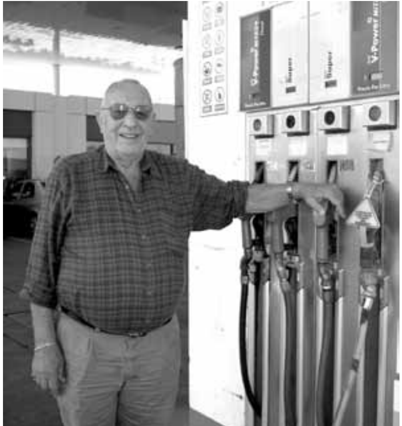
CLAVES DEL EXITO. “Son la honestidad y el trabajo decente”, dice Mándola.