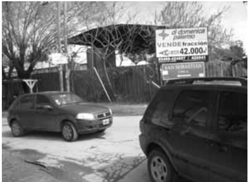
SIN CALMA. Cientos de autos transitan la calle Boote los fines de semana.

Por ahora, el tránsito se debe a que los propietarios van a visitar el lugar para ponerse al día con el avance de las obras. Pero, además, San Sebastián es la sede del campeonato de fútbol de North Champ, lo que convoca a una gran cantidad de gente que los sábados y domingos transitan a altas velocidades.