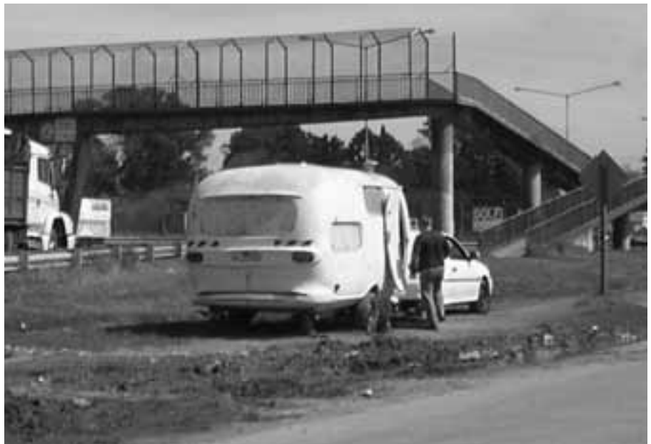
SOBRE LA BANQUINA. La casita rodante está en Colectora Este, frente a la Shell.

ner cerca el baño, las duchas, el bar de la estación de servicio tan tradicional para todos nosotros, donde por un café uno se puede sentar a ver un partido por la tele.